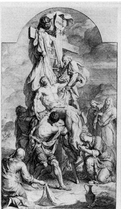
Christus pro omnibus mortuus est. s. 1700 G. P.

Le Vendredi Saint, l'Eglise est en grand deuil. L'autel est nu, la croix est voilée. Le célébrant, en ornements noirs, arrive au pied de l'autel, se prosterne sur les marches, la face contre terre et prie en silence, le temps