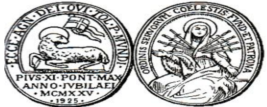
Agnus Dei béni par le Pape Pie XI, en 1925

nous des moyens de nous exercer au regret de nos fautes et à l'amour de Dieu, et d'obtenir ainsi le Grâce sanctifiante.